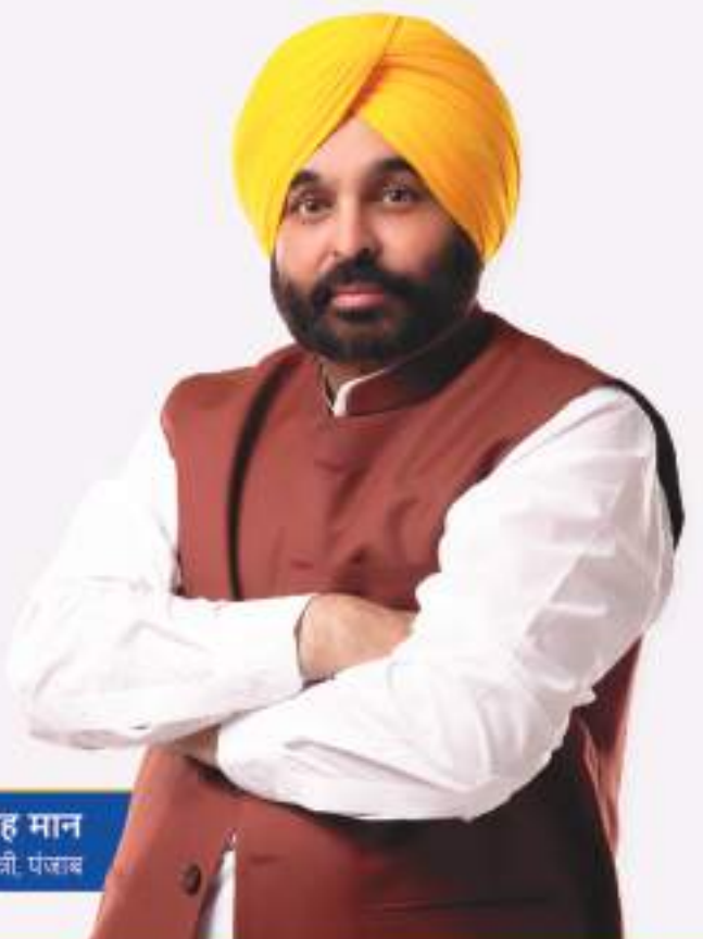
भगवंत सिंह मान मुख्य मंत्री, पंजाब