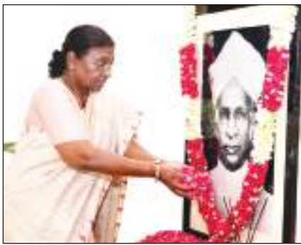
राष्ट्रपति द्रौपदी ने शिक्षक दिवस पर पूर्व राष्ट्रपति डॉ. सर्वपल्ली राधाकृष्णन के तैलचित्र पर पुष्पांजलि अर्पित करती हुई।